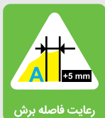
رعایت فاصله برش

به هیچ عنوان برای طراحی پشت پاکت از خطوط و یا طرح هایی که در محل وصل شدن بایستی دقیق روی هم بنشینند استفاده نکنید.