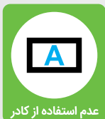
عدم استفاده از کادر